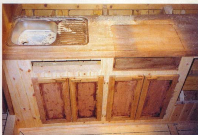
Pantryet tar form.