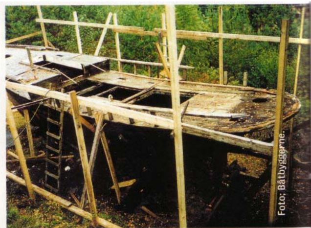
Det gamle vraket til 4000 kroner ble brukt som mal.

Teakbehovet skaffet de til veie gjennom gamle dører og vinduer, mens koøyene ble dreid i bronse.